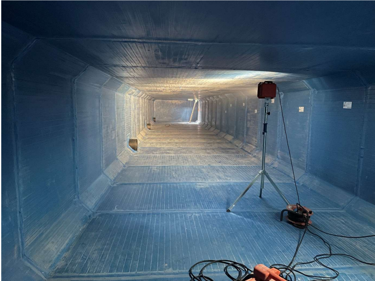
Bassin terminé et disponible

Des tests d'étanchéité ont été effectués avec mise en eau, stabilisation du niveau et mesures à 24h puis 48h. Le débit de fuite est inférieur à 1cm avec validation des essais par la MOE.