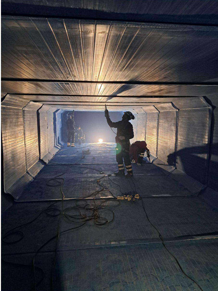
Vérification des soudures