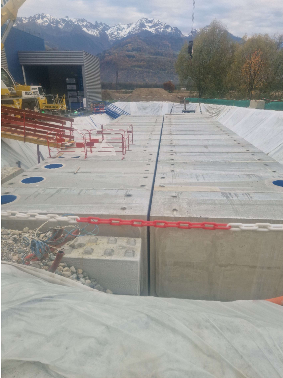
Pose des cadres sur deux lignes

L'entreprise Midali est missionnée pour les opérations de terrassement et de mise en place des cadres. Les équipes Coprem viennent ensuite effectuer les soudures des Joints Liner et des conduites PEHD de communication. Un test systématique par syntylographe est réalisé pour valider la qualité des soudures.