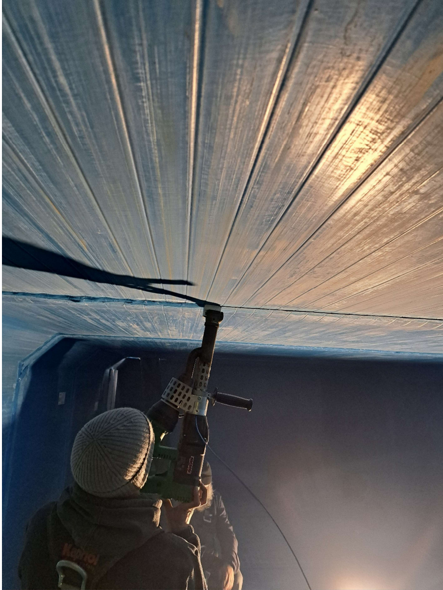
Opérations de Soudure par les équipes Coprem