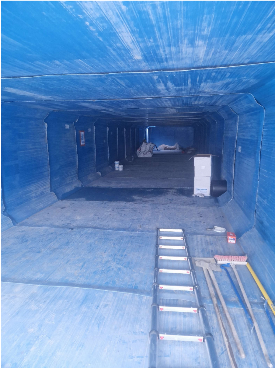
Intérieur du bassin avant les soudures du Liner